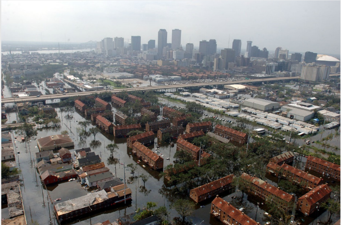
@New Orleans, 2005